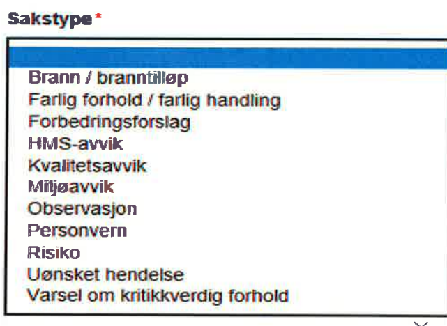
Figur 2 Mulige avvikskategorier i Compendia avvikssystem

Så langt i 2018 er det kommet inn fire saker. To av sakene er i kategorien uønsket hendelse og er knyttet til barnehage. En sak er rapportering av risiko vedrørende en port som ikke lar seg lukke ordentlig i en av barnehagene. Den siste saken som er meldt inn, er et brudd på reglene om personvern i ett av våre treningsentre. Alle sakene blir fulgt opp av de ansvarlige ledere/administrasjonen.